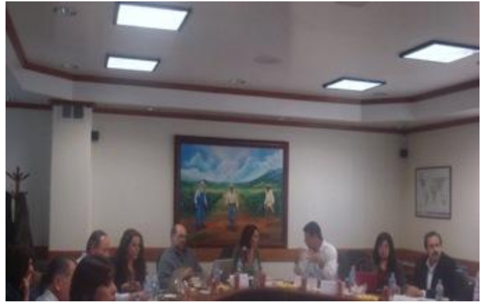
1ª Sesión del CCPCI de 2011