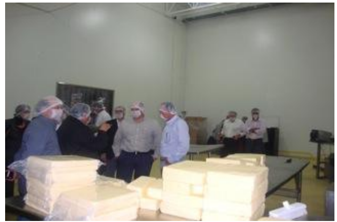
Quesos Finos Santa Clara