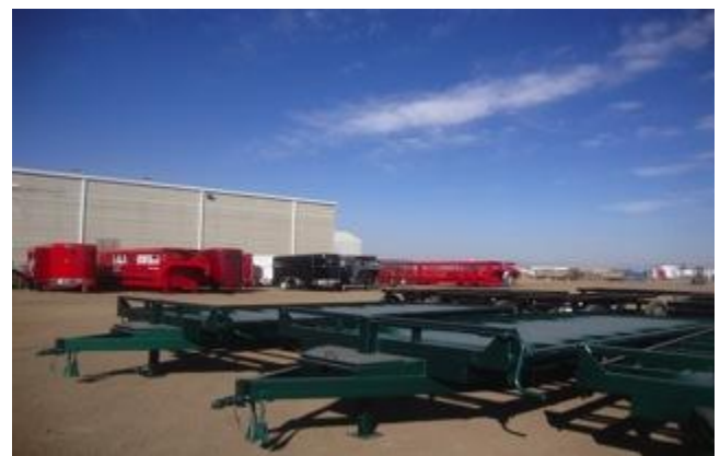
Remolques del Norte