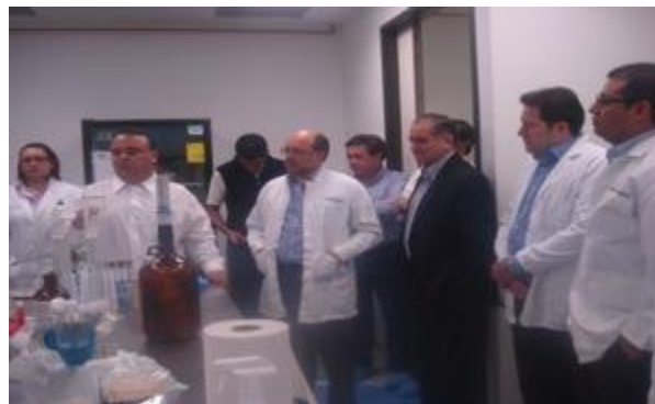
Miembros del CCPCI durante la visita a Química Agronómica de México

Durante la Primera Sesión Ordinaria de 2011 del CCPCI , los miembros del Consejo realizaron visitas a diversas empresas del sector menonita en Cuauhtémoc, Chihuahua.